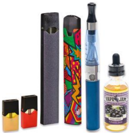
A B C D